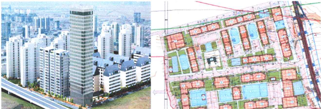
Зураг-3: Эко яармаг төсөл

“Эко Яармаг-1” төслийн төслийн загвар зураг нийт 4 удаа өөрчлөгдсөн бөгөөд 5 дахь шатны зураг төслийг 2025 оны дөрөвдүгээр сарын 15-нд батлагдсан. Шинэ загвар зургаар төслийн хэмжээнд нийт гэр хорооллын дахин төлөвлөлтөөр нийт 36 блок үйлчилгээтэй, орон сууцны 1-26 давхар барилгууд баригдах ба 1,686 айл өрхийн хүчин чадалтай. 240 болон 168 хүүхдийн багтаамжтай хоёр цэцэрлэг, 360 хүүхдийн хүчин чадалтай сургууль зэргийг төлөвлөсөн.