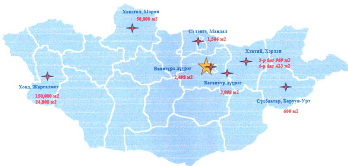
Зураг-8: Төслийн хяналт