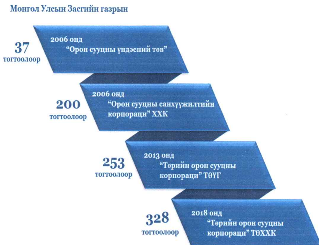
Зураг-1: Түүхэн замнал

Тус компани нь 2006-2016 онд нийт 548.5 тэрбум төгрөгийн төсөв бүхий төсөл, хөтөлбөрүүдийг Улаанбаатар хот, орон нутагт хэрэгжүүлснээр 7,111 орон сууц барьж, 7,635 иргэнд зээл олгосноор 10 жилийн хугацаанд нийт 14,746 айл, өрх орон сууцтай болсон.