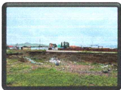
Зураг-5: Сонгон шалгаруулалтын байршил