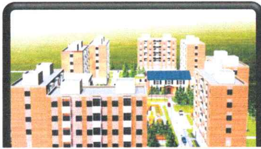
Зураг-7: 2026 онд сонгон шалгаруулалт хийх боломжтой байршил

Байршил: Хөвсгөл аймаг Мөрөн сум 13-р баг Газрын хэмжээ: 5.0 га Үнэлгээ: 1,191,600,000 Хүчин чадал, төлөвлөлт: - 480 айлын 8 блок орон сууцны барилга - 320 хүүхдийн сургууль - 100 хүүхдийн цэцэрлэг