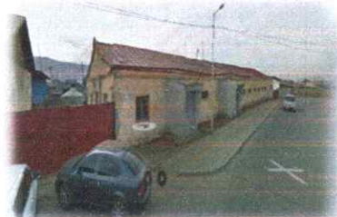
Зураг-6: Гүйцэтгэгч сонгогдсон байршил