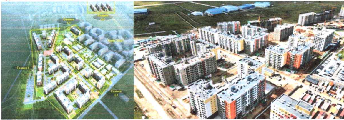
Зураг-2: Солонго-1, 2 төслийн 3D харагдах байдал

Эхний ээлжид ашиглалтад оруулах 27 блокийн каркас угсралт бүрэн дууссан, дотор, гадна заслын ажил, инженерийн шугам сүлжээний ажлууд хийгдэж байна. Төслийн талбайд инженер, техникийн 26, захиалагчийн хяналт 2, ажилчин 1,021, нийт 1,069 хүн 7 кран, 6 экскаватор, 11 авто самосвал, 3 ковш, нийт 27 техник хэрэгсэлтэйгээр ажиллаж байгаа бөгөөд гүйцэтгэлийн явцыг 56% гэж дүгнэсэн.